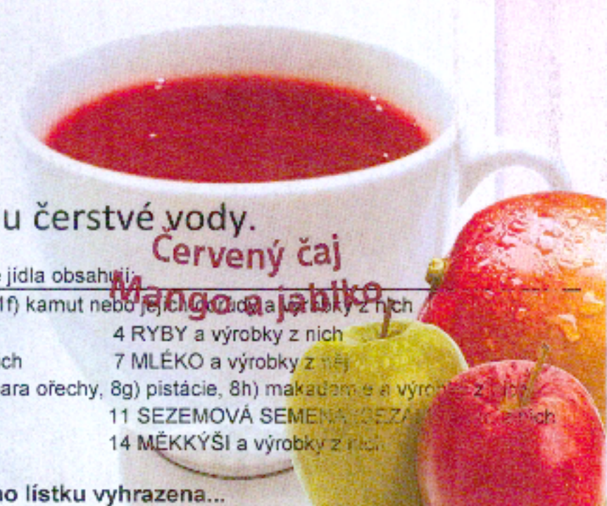
Červený čaj Mango a jablko

Po celý den je zajištěn pitný režim formou čerstvé vody.